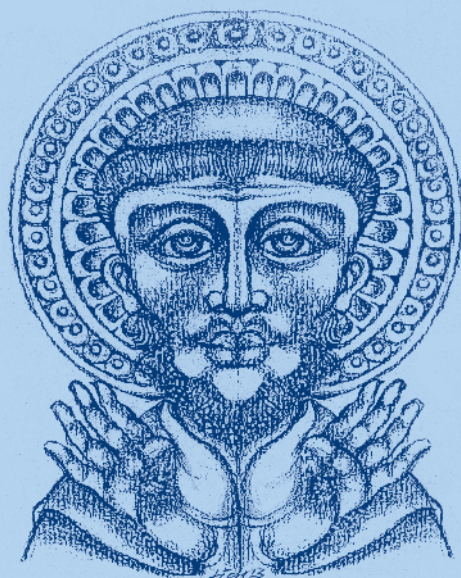
SV. FRANTIŠEK Z ASSISI