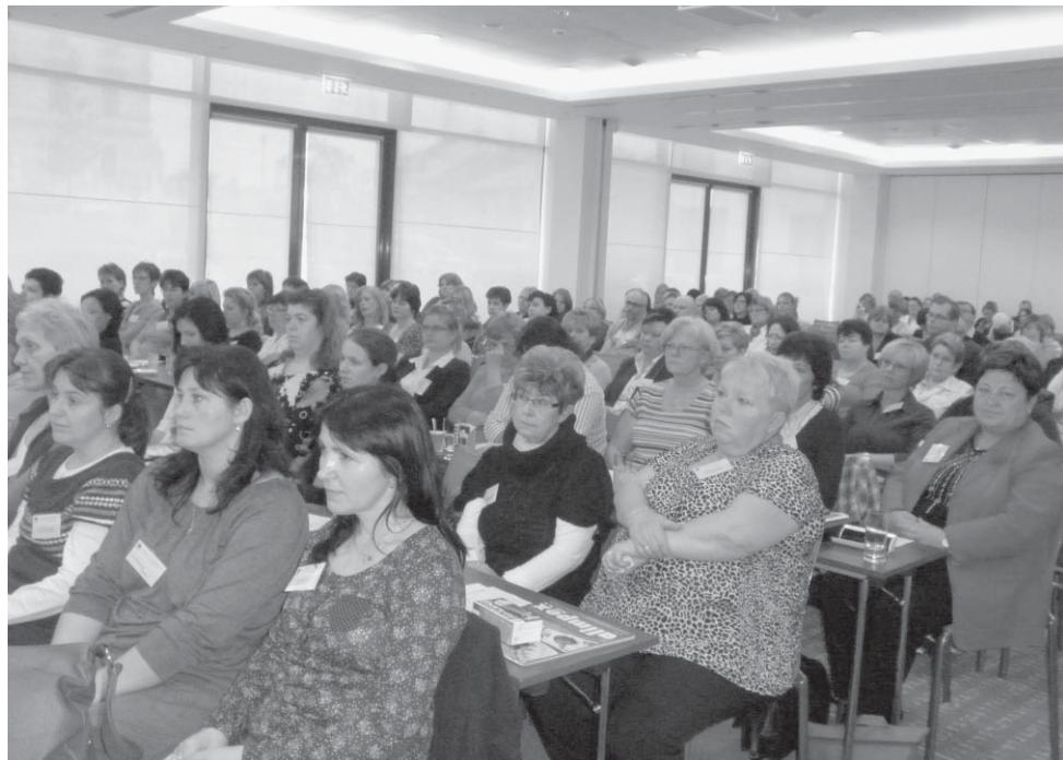
Z konference Charity ČR.

Člověk si často ve víru denních povinností tuto skutečnost ani neuvědomuje, ovšem konference jasně ukázala obrovský kus práce, který pracovníci charit - ředitelé počínaje a řadovými pracovníky konče - za dvacet let odvedli. Z počátečních chudých středisek, kde ovšem vládl entusiasmus a nadšení, vyrostla profesionální střediska poskytující kvalitní odborné služby, o kterých se bez nadsázky dá říci, že jsou zárukou nejvyšší kvality.