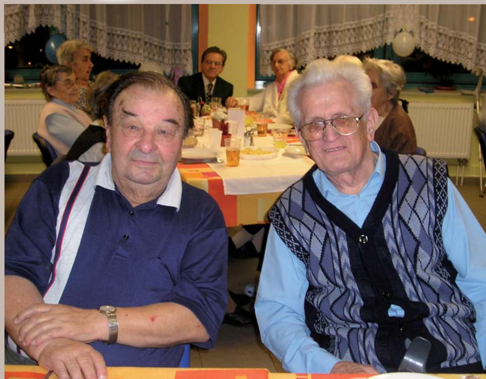
DOMOV PRO SENIORY SV. JIRÍ