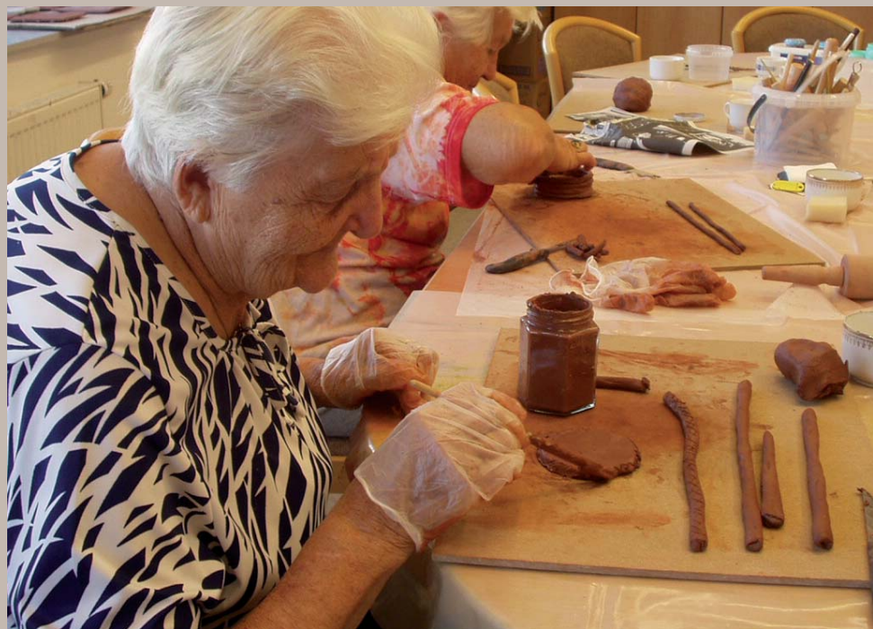
DOMOV PRO SENIORY SV. JIŘÍ