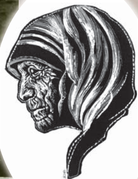
MATKA TEREZA Pomocnice všech potřebných