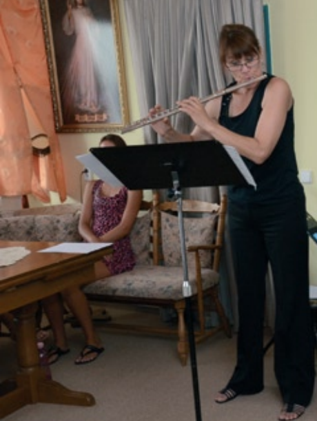
Domov sv. Jiří